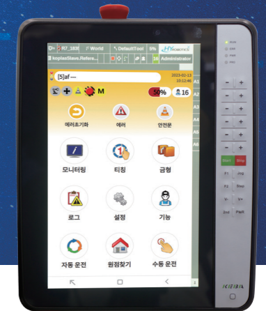
▲10.1in 대형 화면

한양로보틱스의 사출 전용 회전 다관절 로봇 S 시리즈는 초보자도 쉽고 간편하게 취출 및 자동화 작업이 가능합니다.